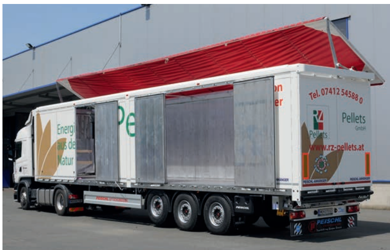
Všestranný náves: kombinácia patentovanej hydraulickej strechy na sypký materiál PEISCHL a prídavných bočných dverí po celej dĺžke bočnej strany.