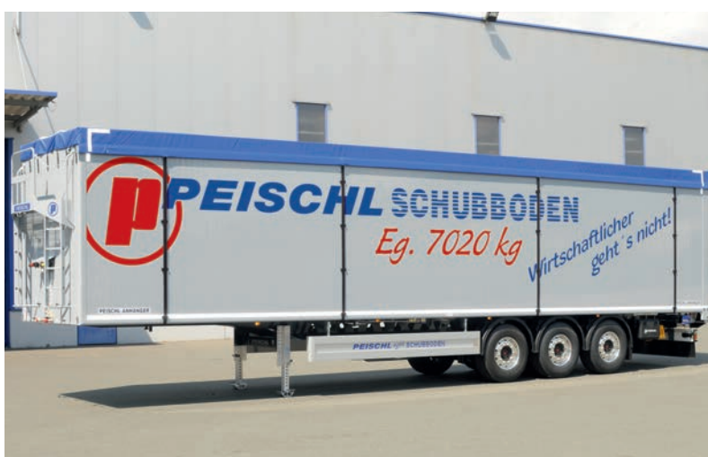
Štandardný náves s posuvnou podlahou. Najľahší svojho druhu na európskom trhu s úžasnými 7 020 kg pri objeme 91 m 3 .