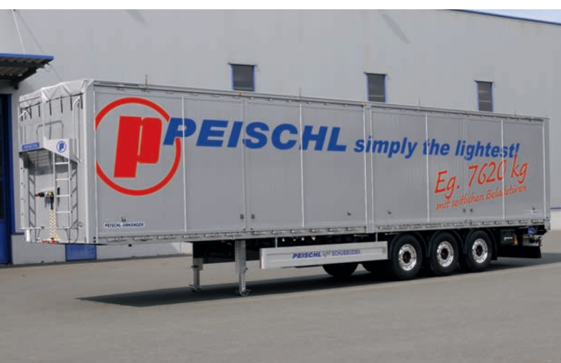
Náves s posuvnou podlahou s bočnými nakladacími dverami po celej dĺžke vozidla. Najľahší svojho druhu na európskom trhu s úžasnými 7 620 kg pri objeme 91 m 3 .