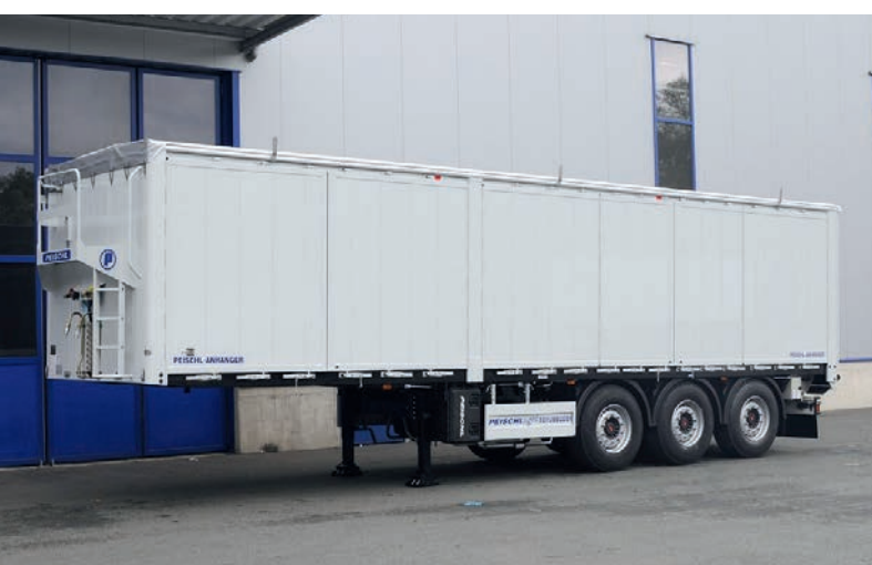
Náves „Baby“ s posuvnou podlahou s bočnými nakladacími dverami po celej dĺžke vozidla. Najľahší svojho druhu na európskom trhu.