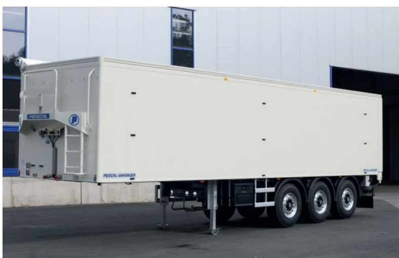
Prvá európska posuvná podlahou s objemom 53 m 3 s vlastnou hmotnosťou menšou ako 6 t! Náves „Baby“ s posuvnou podlahou s hmotnosťou 5 600 kg.