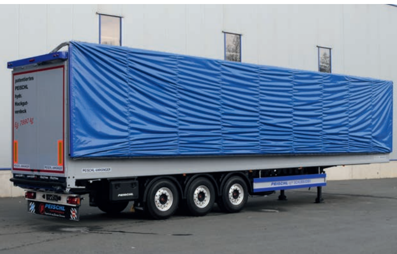
Patentovaná hydraulická strecha na sypký tovar PEISCHL vl. hmotnosť 7 690 kg.